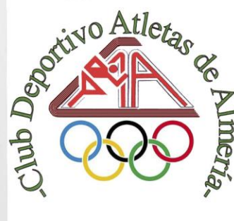
Club Deportivo Atletas de Almería, aportan su red de deportistas y actividades al servicio de ocio.