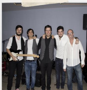
Los Vinilos, donan su talento musical para celebrar nuestro 18 aniversario.