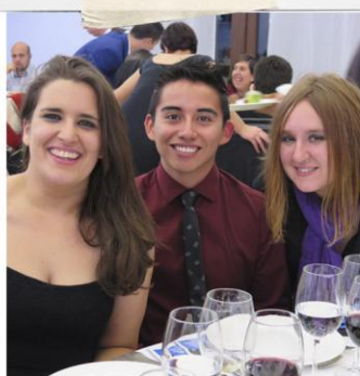
CineJoven, se une para colaborar con nuevas ofertas de ocio en el ámbito audiovisual.